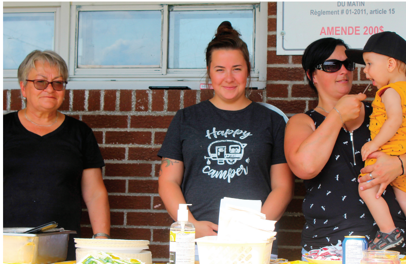
Bénévoles pour le barbecue estival - Tourville