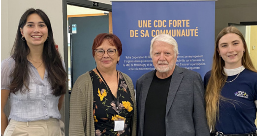
Table de développement social de la MRC de L'Islet