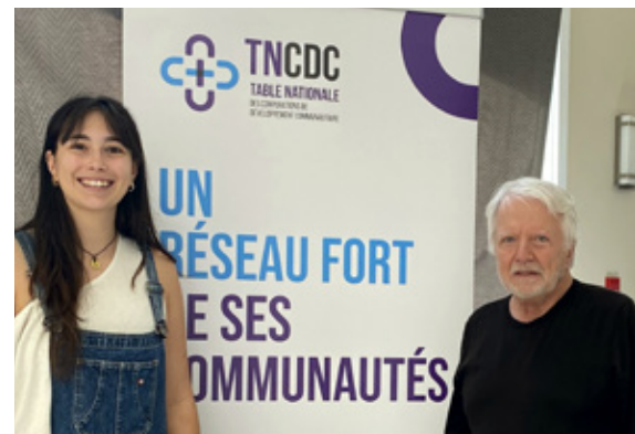
Table régionale de lutte contre la pauvreté

En mars 2025, l'équipe de la CDC ICI Montmagny-L'Islet est allée à la rencontre nationale des CDC lors du Grand Rendez-vous. L'objectif de cette rencontre était de permettre à toutes les CDC du Québec accompagnées de leur équipe, de réseauter, partager, s'inspirer.